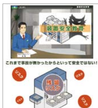
WEBを用いた設置安全教育

装置の設計・開発段階における安全への配慮は社内だけでなくお客様からの要望もあり、ますます重要視されています。この取り組みの一環として2007年度に装置安全教育をWEB上で行いました。この教育では、装置安全設計のためのリスクアセスメントについての内容や、事故事例を通して装置設計に必要な安全に関する知識を