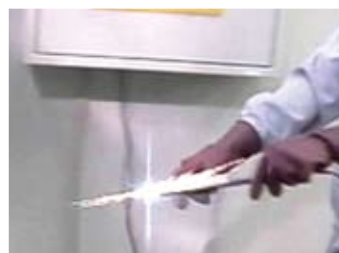
感電体感での電極

感電体感では、電圧が印加された電極を利用します。電極同士をあてると火花が散りますが、受講者は素手で触り、感電を体感します。12Vバッテリーを3つ直列につないだ電源ですので、触っても人体には影響しない程度です。