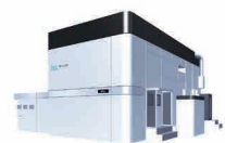
有機ELパネル製造用 インクジェット描画装置 Elius™