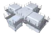
FPD プラズマエッチング/ アッシング装置 Impressio™