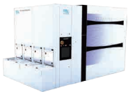
枚葉洗浄装置 CELLESTA™ z