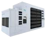
コータ/デベロッパ CLEAN TRACK™ LITHIUS Pro™ Z