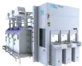
ガスケミカルエッチング装置 Certas LEAGA™