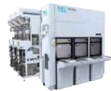
プラズマエッチング装置 Tactras™ Vigus™