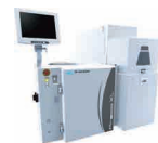
ウェーハプローバ Precio™ XL