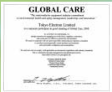
東京エレクトロンはSEMIが主催するGlobal Care™プログラムへの賛同を宣言しています。

環境・健康・安全は一企業の努力だけでは限界があり、サプライチェーンを横断した半導体、FPD業界全体としての協力が必須となっています。東京エレクトロンは業界のリーダーとして、Semiconductor Equipment & Materials International (SEMI)が主催するGlobal Care™ プログラムに参加し、様々な活動を行っています。