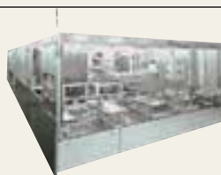
LCDコータ/デベロッパ CS800