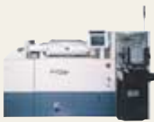
全自動ウェーハプロバ P-12XL