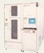
ウェーハレベル・バーンイン&テスト装置 WX-8