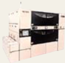
コータ/デベロッパ CLEAN TRACK ACT®12