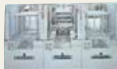
LCDプラズマエッチング/アッシング装置 HT-800