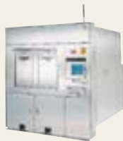
エッチング装置 UNITY® Ver. IIe