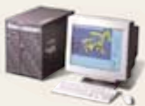
Hewlett-Packard Co. HP Visualize Workstation