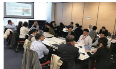
2018年11月におこなわれたCSRグローバル推進会議

TELでは、中長期的な企業価値向上の観点から事業戦略との統合を図りながら、サステナビリティマネジメントを展開しています。CSRの活動は以下の3つの会議体を中心に推進しています。CSRに関する最高意思決定機関であるCSR定例会議では、グループ全体の方針や重要案件についての話し合いをおこない、全世界のCSR責任者が参加するCSRグローバル推進会議においては、CSRの短中期目標やグローバルプロジェクトの推進などについて討議しています。また各部署の担当者が参加するCSR月次連絡会ではCSR活動に関する情報共有をおこない、横断的なテーマに取り組むための連携体制を構築しています。