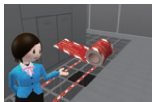
バーチャルリアリティを用いた映像

内でグローバルに情報を共有しています。また、開口部作業、高所作業、重量物作業時などの事故防止のため、安全教育ツールの一つとして、各種安全講習などにおいても使用しています。さらに、簡単に言葉やイラストでは表現できない事例については、3Dバーチャルリアリティー技術を導入し、現場で起きた事故をリアルに再現する映像を用いて、事故の概要、原因、時系列でのコミュニケーション状況の一連の流れと、実際に取られた対策を視聴・体感することができます。今後は、これらの事故事例や事故の統計データを業界内で共有することも計画しています。これらの活動が業界全体の安全啓発につながり、世界中の作業現場で働くエンジニアが安全かつ安心して働ける作業環境の構築に寄与することができ、当社グループの社会的責任を果たすことにもつながると確信しています。