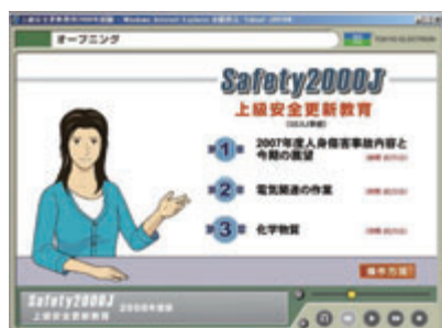
上級安全更新教育

育」のテキストを利用し、そのガイドラインに従った運用をし、初回時は実習を含んだものとしています。SEAJのガイドラインでは3年に一度の更新教育が記載されていますが、当社グループではWEBを利用して、この更新教育の内容を三つに分割して、毎年実施しています。当社グループで発生した事故やヒヤリハットの事例を入れることにより、受講者の危険意識を高め、実際の業務に役立つものを目指しています。また、WEBを利用することにより、インターネットにて学習できるため、個人の業務都合により時間を問わず履修することができます。さらに、履修状況がWEBにてわかるため、教育対象者へ履修が完了するまでフォローすることができます。今後は、更新教育にて実習を行うことも計画しています。