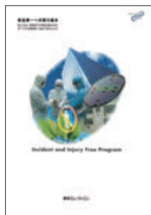
安全第一への取り組み冊子

1999年12月に「健康と安全」が重要であるとの考えに基づき、経営理念に「安全と健康と環境について」を加えてから10年が経過しました。この考え方は今もなお「安全・健康・環境」の原点です。当社グループでは「安全・健康・環境」に配慮することが、良いビジネスへと結びつくと考えています。人命および各種設備や機器の安全性を損なってまで、利益や納期を優先するようなことがあってはいけません。こうした考え方や当社グループにおける安全への取り組みを、お客様を含む幅広いステークホルダーの皆様