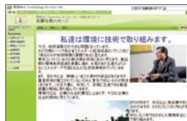
社内イントラネット

環境関連の取り組みについては、当社グループ内の先進事例やトップメッセージ、会議資料などを掲載した社内イントラネットホームページを2007年に開設しました。