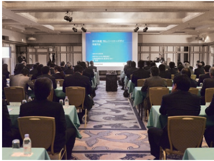
2013年度に開催した「TELパートナーズデイ」

取引先さまとの関係を重視し、当社の事業概況・活動方針などを共有するために、生産動向説明会を開催しています。2013年度秋季説明会には、約300社の取引先さまに参加いただきました。